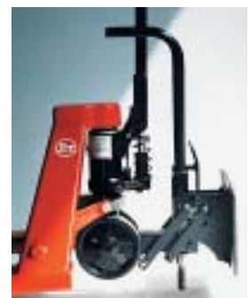
Handhubwagen für Förder- und Schleppverbandsysteme.

Wünschen und Spezifikationen zu bauen, dies schließt auch Einzelanfertigungen ein.